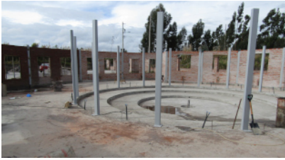
planetarium en construction